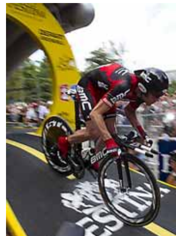
Tourwinnaar Cadel Evans.

Tourstart goed idee als trekker Floriade