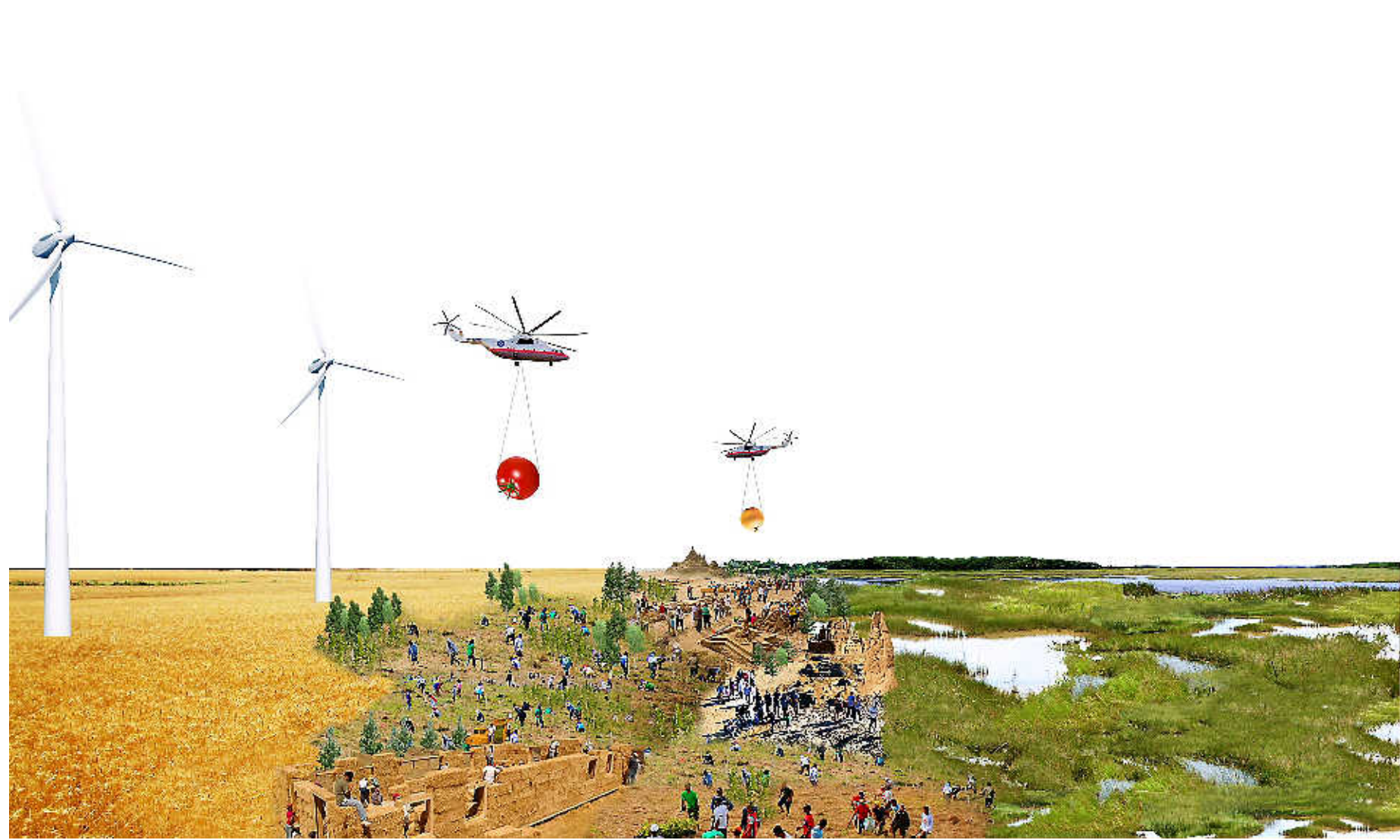
Een impressie van de Floriade in 2022 in Wieringen/Wieringermeer (vanaf komend jaar gemeente Hollands Kroon).

Liggend aan de A7 is de locatie WIERINGEN/WIERINGERMEER uitstekend bereikbaar. Glastuinbouwgebied Agriport in de Wieringermeer is de laatste jaren de snelst groeiende agrarische sector van Nederland. In 2020 kunnen de kassen in Agriport stroom leveren voor 200.000 huishoudens. Aan twee